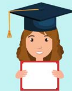
Continu blijven leren en ontwikkelen voordat je iets kunt doen