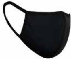
katoenen mondmaskers in diverse kleuren