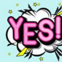
Pleasen/geen nee durven zeggen