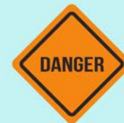
extreme, gevaarlijke of zelfdestructieve activiteiten