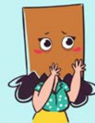
Niet laten zien hoe je je voelt